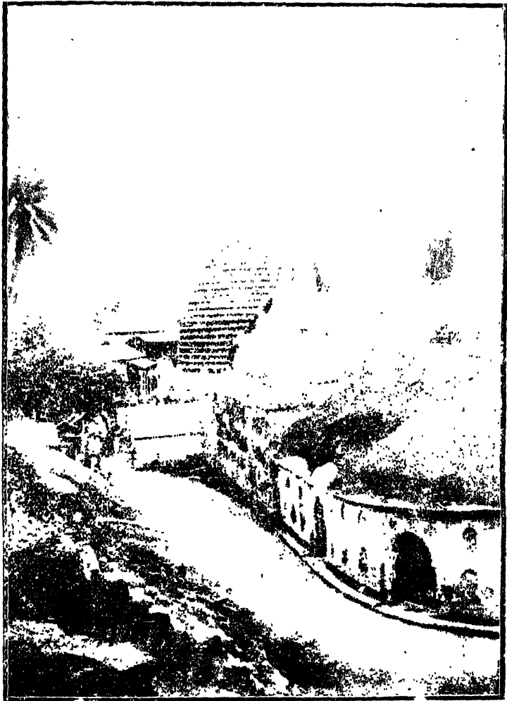
কন্যাকাপ্যা দেবীর মন্দির